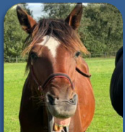
WON'T BACK DOWN

H v. Victor Gio – Graceland