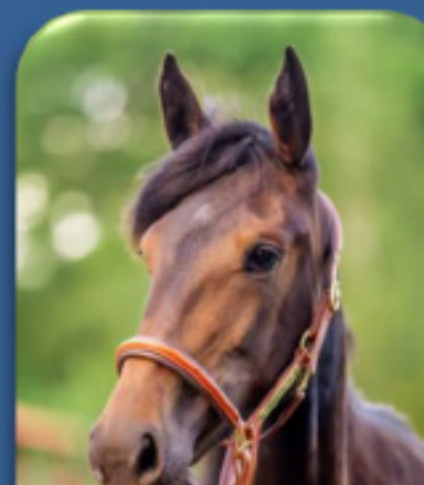
WAKE ME UP